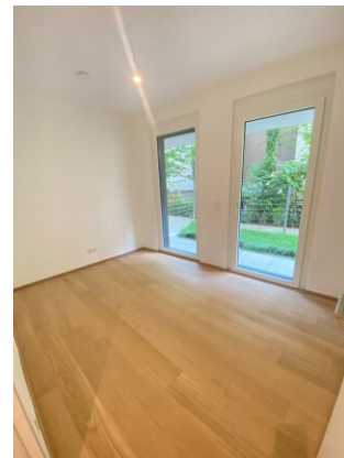
Kinderzimmer - Büro