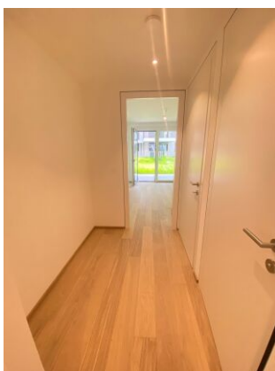
Schrankraum - Schlafzimmer