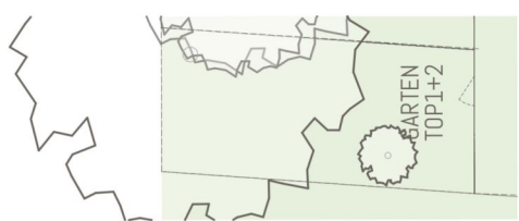
TOP1+2 Übersichtsplan Garten