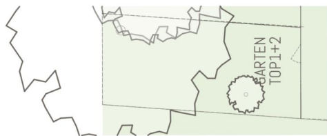
TOP1+2 Übersichtsplan Garten