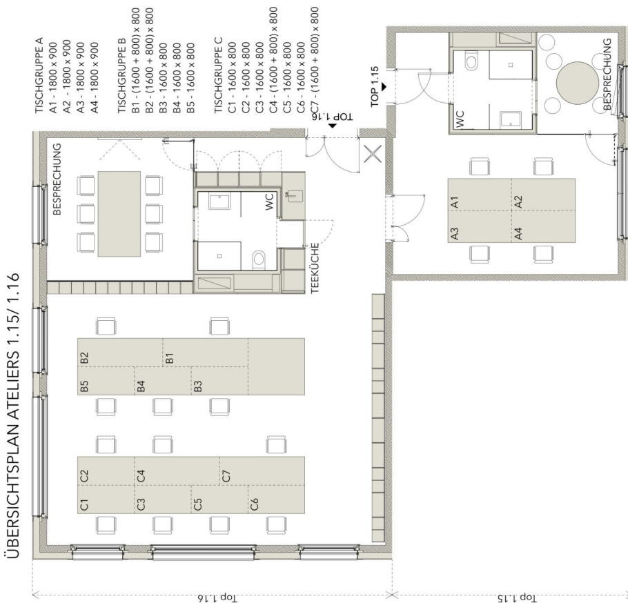
BEILAGE A ÜBERSICHTSPLAN