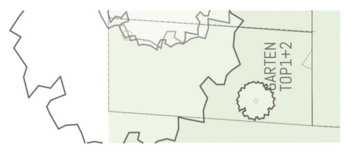
TOP1+2 Übersichtsplan Garten