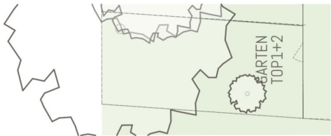
TOP1+2 Übersichtsplan Garten